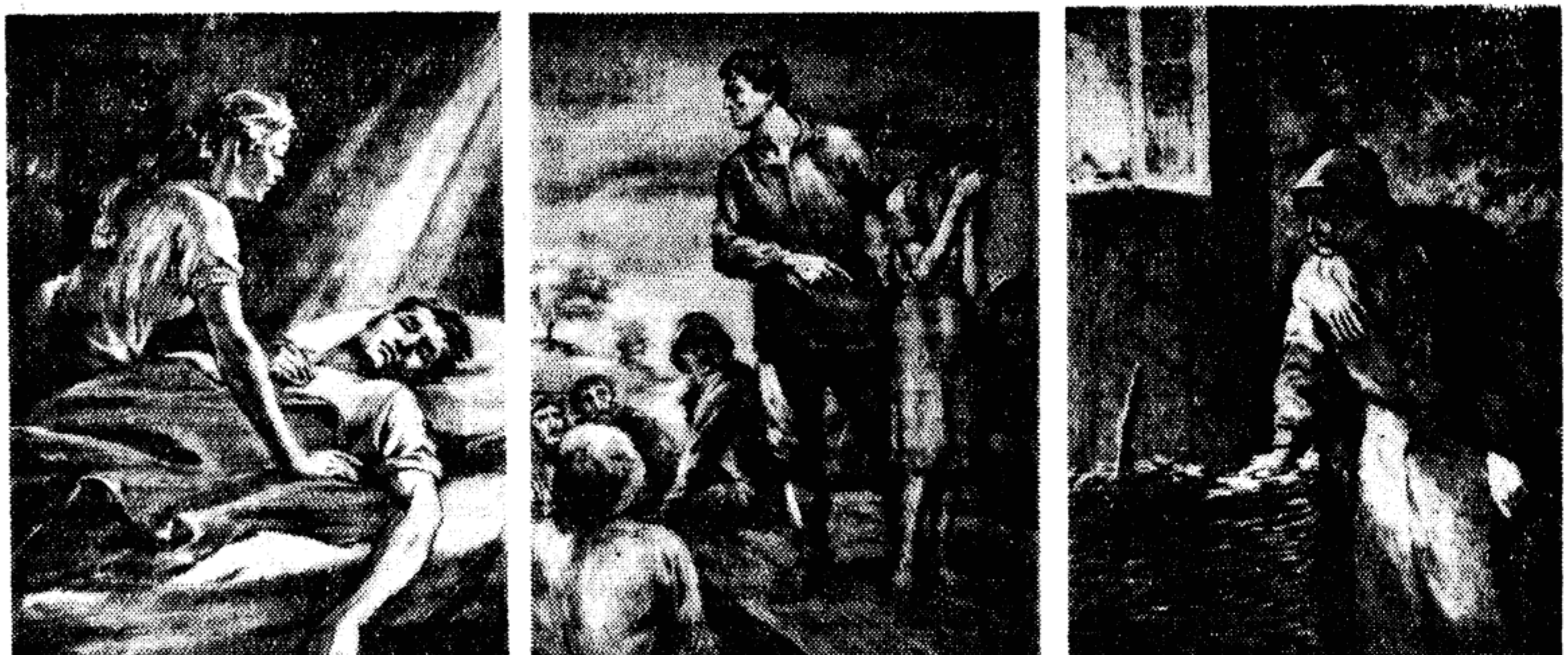
Иллюстрации художника Ивана Гурро к одноименным произведениям Константина Лордкипанидзе «Дорогу осилит идущий».