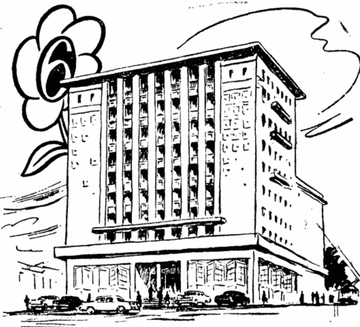
МЫ ПРИЕХАЛИ в Подготовительный комитет фестиваля около восьми утра. Метлы дворников еще шуршали по мокрому, алчный репродуктор советовал заняться военными процедурами, и даже на дверях булочной еще висел замок.

БЕСКОНЕЧНО долг путь от Москвы до Серпухова... БЕСКОНЕЧНО долг путь от Москвы до Серпухова — целых два часа. До Киева куда ближе: какой-нибудь час с минутами — и пассажир на берегах Днепра. Но это при условии, если скорому поезду не предпочтут кабину турбовоздушного самолета «Украина».