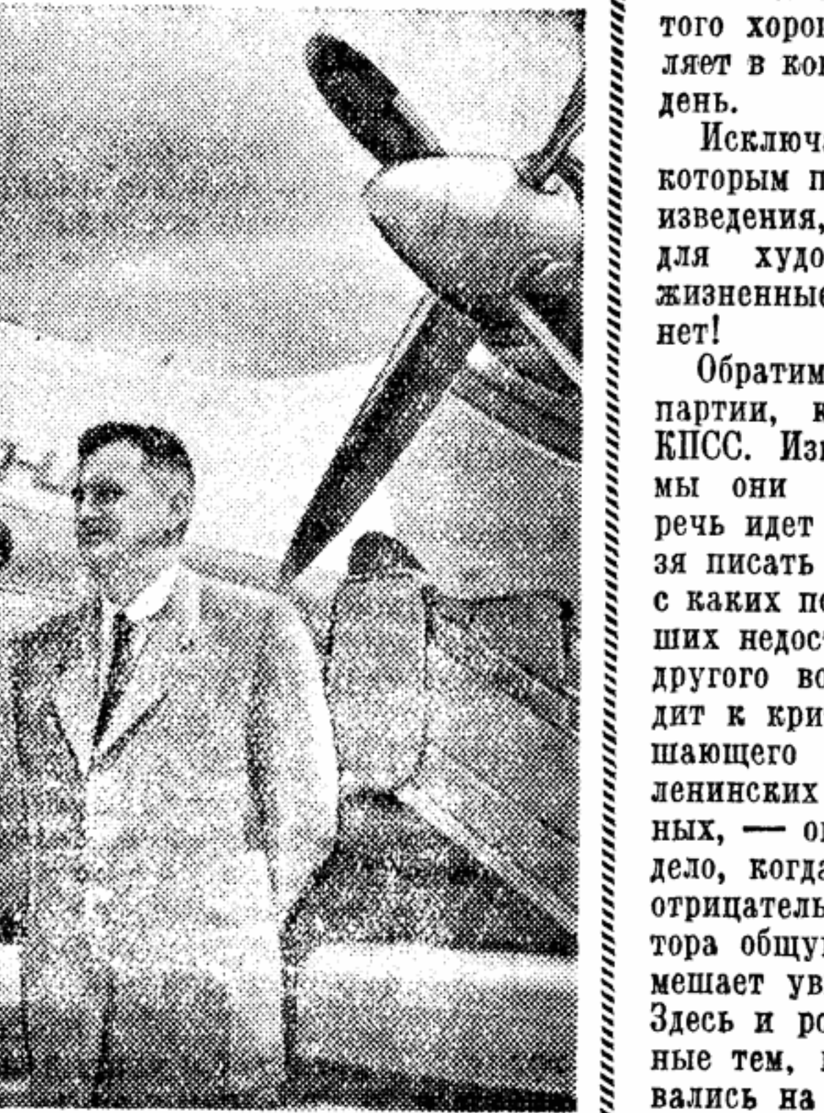
На снимке: главный конструктор самолета «Украина» О. К. Антонов.

Многим тысячам людей приходилось в своей жизни совершать дальние перелеты на борту самолета «ИЛ-12». Добрая эта машина, и поныне бороздит она просторы пятого океана.